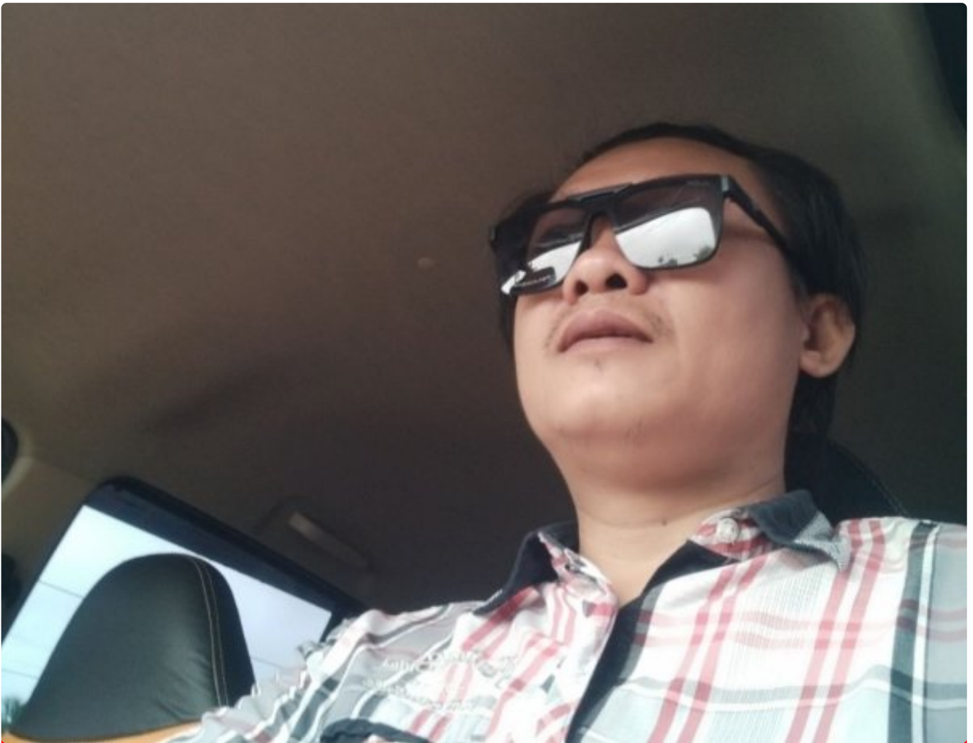
Pohon dan Manusia Logika Nyata Dalam Kehidupan

OPINI- Menanam pohon itu tak langsung berbuah tapi butuh sentuhan kasih sayang terhadap pohon itu sendiri.